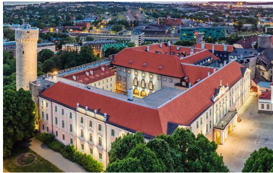
Estlands rigsdag - Riigikogu

Om formiddagen besøg i den estiske rigsdag , hvor vi først får en rundvisning. Herefter møde med en ledende politiker fra det liberale Reformparti , Venstres søsterparti. Besøget afsluttes med frokost i Rigsdagens restaurant. Herefter transfer til Tallinn lufthavn